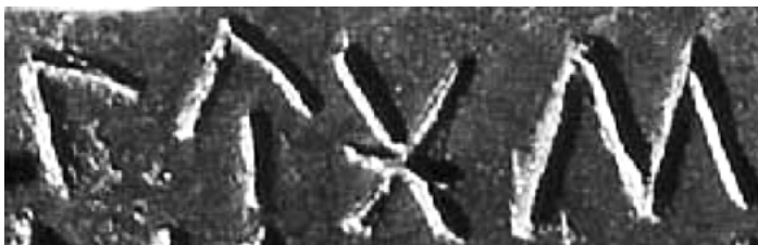
Fig. 2. Detalle de la tésera Froehner (Z.00.01): lubos (Fotografía BDHesp).

En escritura celtibérica lubos se documenta en la tésera Froehner de procedencia desconocida que identifica en la interpretación tradicional (Untermann 1997, Z.00.01) a un personaje originario de Contrebia Belaisca, que corresponde al yacimiento de Botorrita, o bien a un pacto de lubos con la propia ciudad de Contrebia Belaisca (Jordán 2004, 265): lubos · alizo/kum · aualo · ke(ntis) / kontebiaz / belaiskaz . De Botorrita son los otros dos claros ejemplos de lubos : En el primer bronce (Z.09.01) aparece como uno de los censados lubos kounesikum melmunos kentis . En el bronce latino de Botorrita, aparece una vez como uno de los firmantes, Lubbus Urdinocum Letondonis f. praetor , y otras tres como padre de otros firmantes: Lesso Siriscum Lubbi f. (ma)gistratus , Segilus Annicum Lubbi f. magistratus , Ablo Tindilicum Lubbi f. magistratus . En un texto menos claro también aparece en la forma Lubos en la tésera latina de Ubierna (Burgos; BU.02.01).